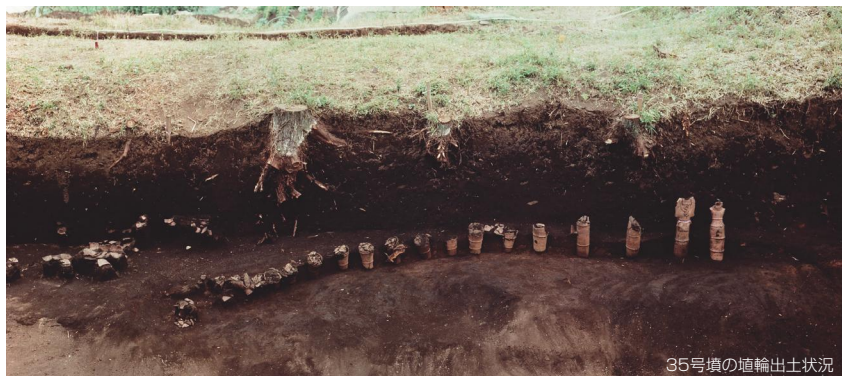
35号墳の埴輪出土状況

会期／平成30年11月10日(土)～平成31年1月31日(木) 開館時間／午前9時～午後4時30分